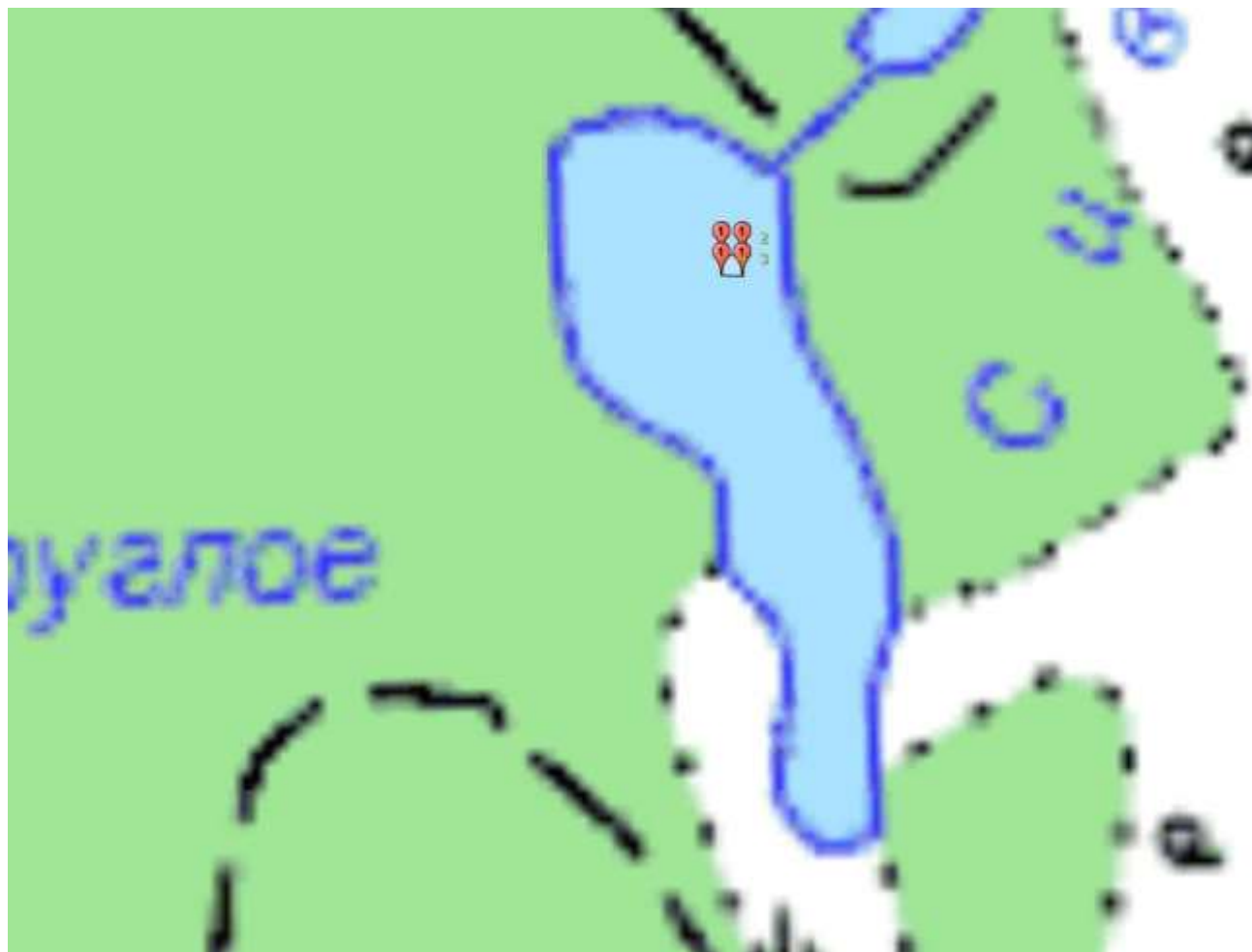
Схема рыбоводного участка № 1.12.1: озеро Сиветское