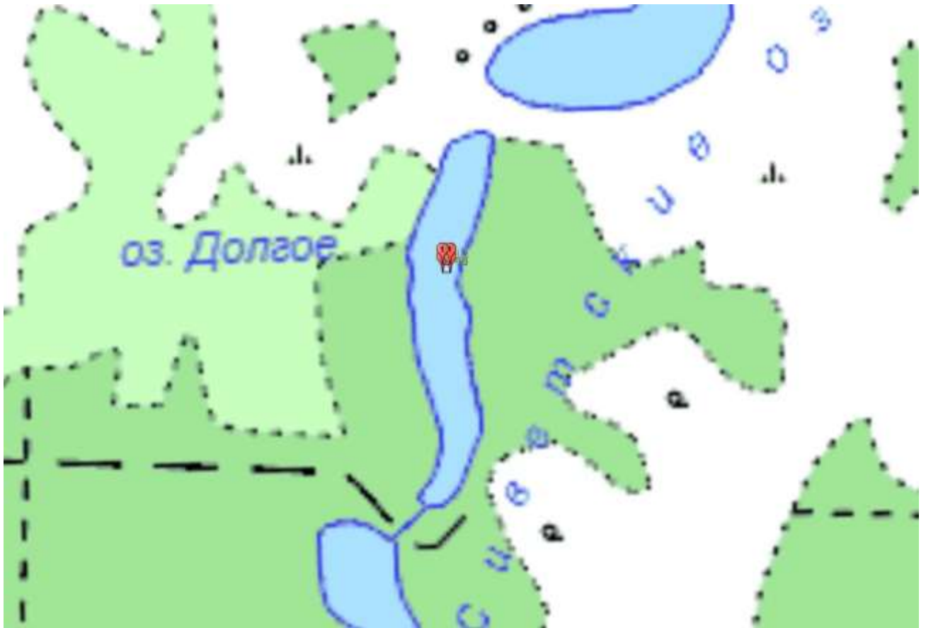
Схема рыбоводного участка № 1.12.2: озеро Долгое