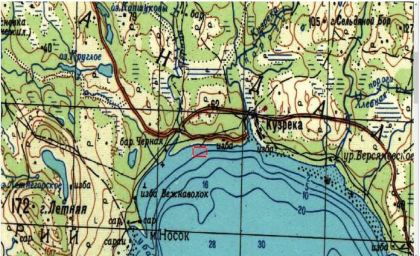
Лот № 14: рыболовный участок № 472: Вежнаволок (изба Вежнаволок)