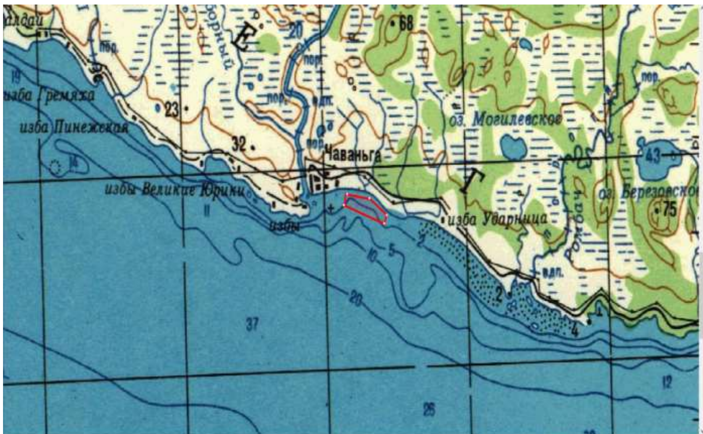
Лот № 6: рыболовный участок № № 442: губа Лов 2 (Ручьевая)