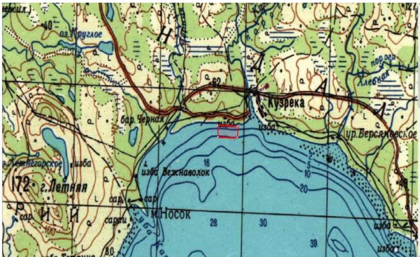
Лот № 12: рыболовный участок № 470: Хлебный (р. Хлебная)