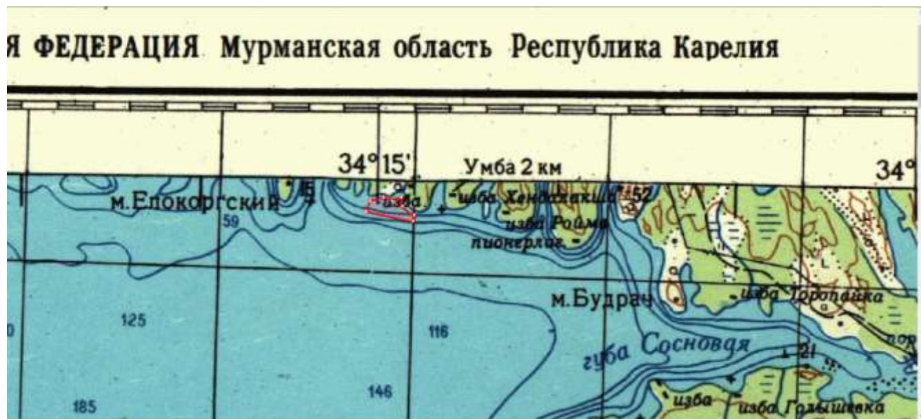
Лот № 8: рыболовный участок № 453: губа Карж