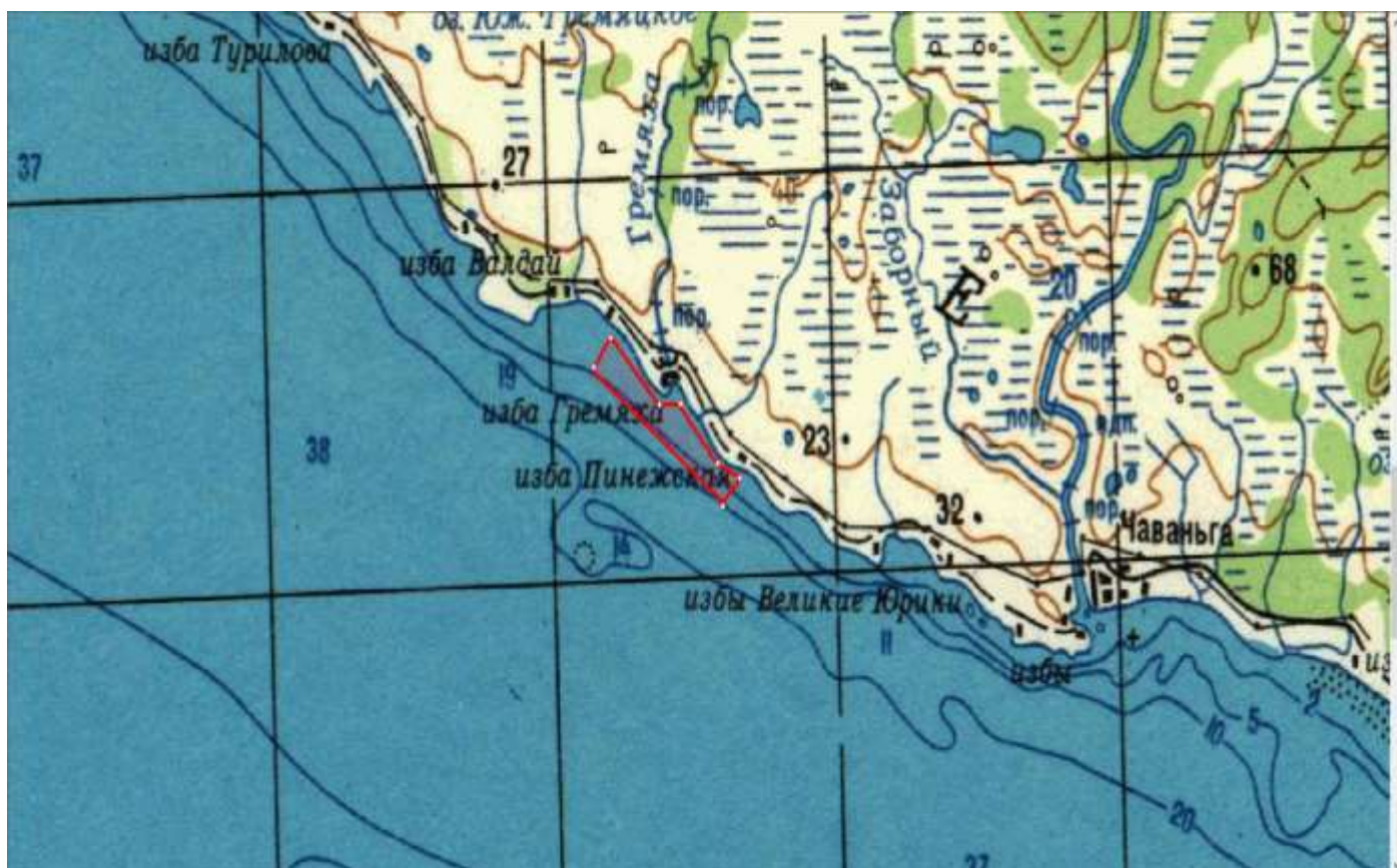
Лот № 4: рыболовный участок № 424: Галдарея (р. Чаваньга)